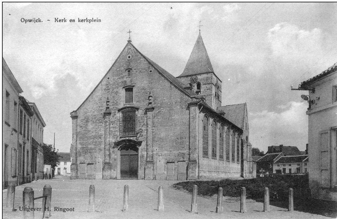
Op deze foto (oude prentkaart) ziet men duidelijk dat de noordoostgevel van het gebouw rechts (latere bakkerij Mannaert), wellicht vanaf de 2de helft 19de eeuw, voorbij de (aanvankelijke) zuidwestgrens (arduinen paaltjes) van het kerkhof (kerkdomein) staat.