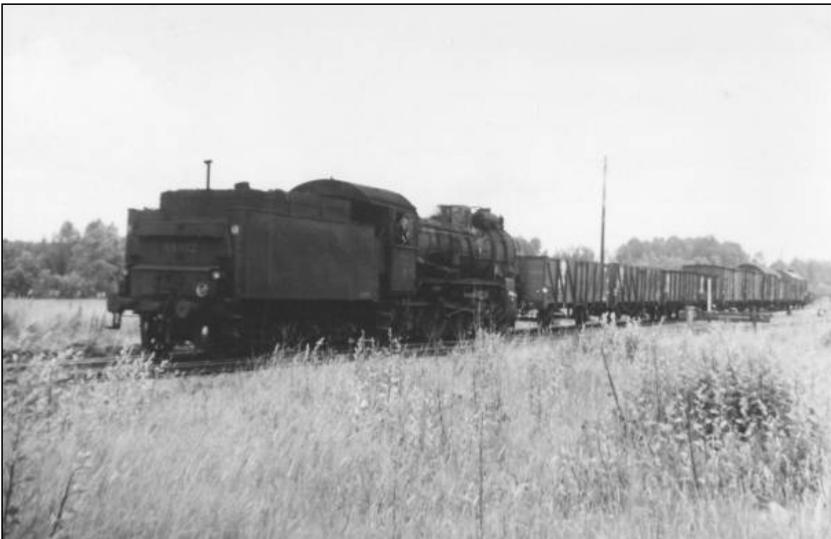
Boven: Leireken in Baardgem 1963 –

Op andere plaatsen stopte Leireken ook wel eens, als er een koe in de weg liep bijvoorbeeld, maar dat was eigenlijk de bedoeling niet.