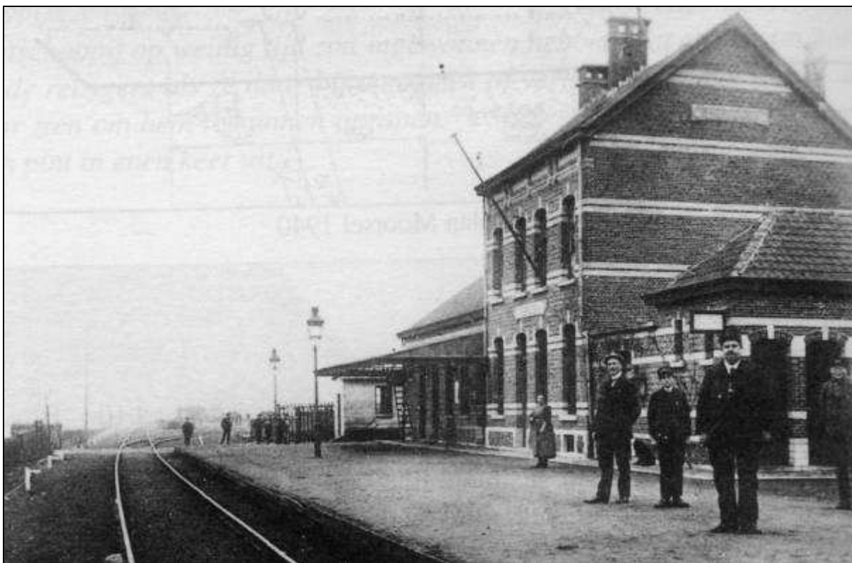
Baardgem anno 1924

Aan de loketten werden geen koepons meer uitgereikt, wel nog abonnementen. Het schrijven van reisbewijzen werd vanaf dan aan de treinwachters overgelaten.