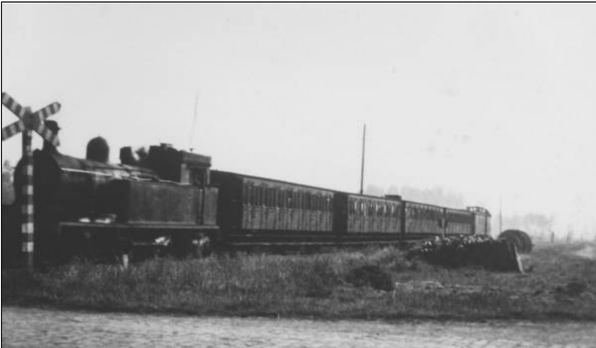
Baardegem 1957: de eerste trein, om 07h30, op de laatste dag...

Op 2 juni 1957 werd (volgens bronnen van de NMBS zelf) de reizigersdienst op lijn 61 afgeschaft. Eén dag eerder reed inderdaad de laatste officiële 24 reizigerstrein van Baardegem naar Opwijk (met locomotief 16.007).