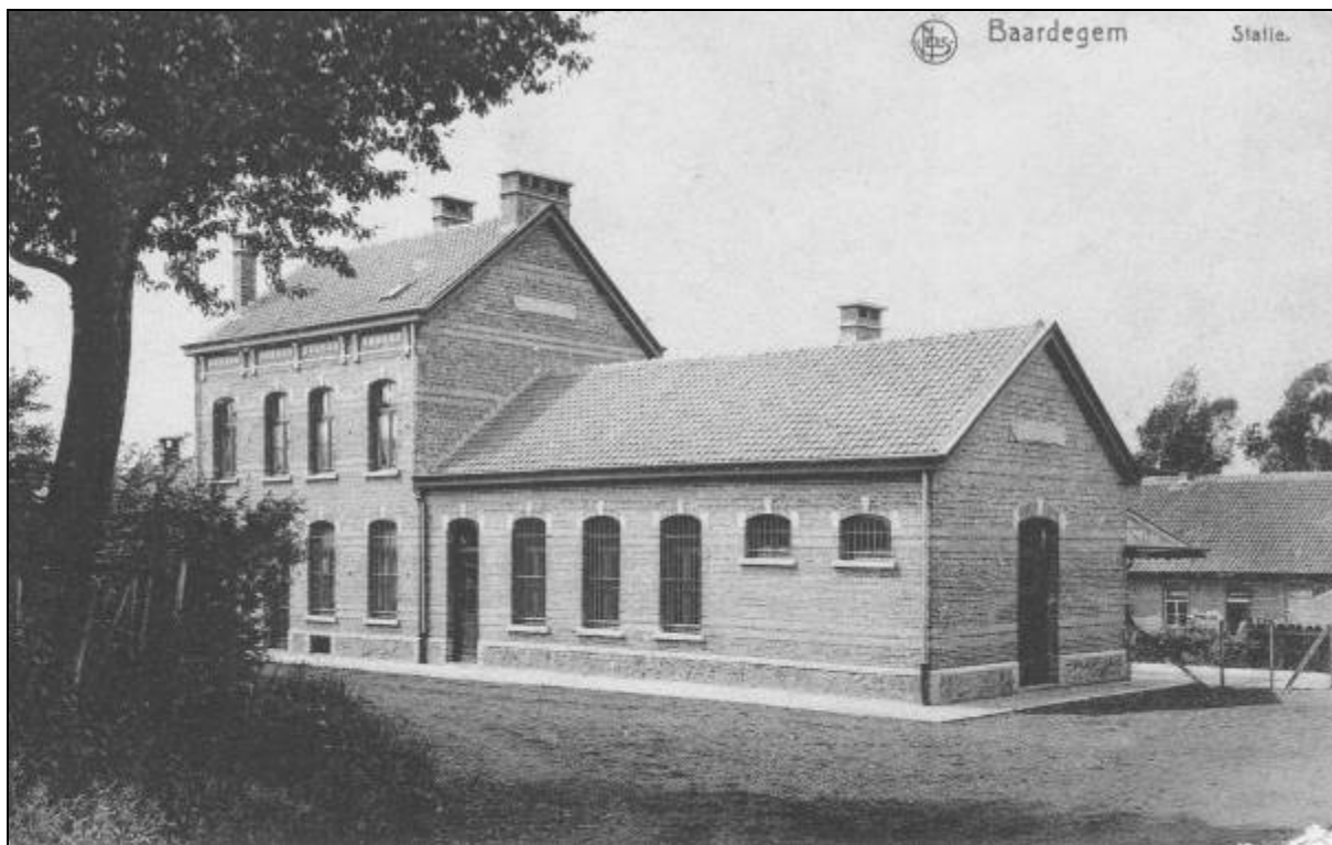
(Ontvangstgebouw) van het station van Baardegem, anno 19??.

Het hier afgebeelde ontvangstgebouw werd dus niet in 1907 voltooid zoals een aantal bronnen beweren. Waarschijnlijk werd het in 1913 gebouwd. Dat jaar is het namelijk voor de eerste keer op de kadasterkaarten verschenen.