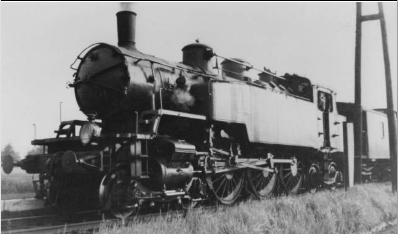
Nijverseel 1950: locomotief van het type 94.

Het treinverkeer van lijn 61 kon het nog wel tot in het begin der vijftiger jaren roeien maar kreeg het toen zeer moeilijk door de opkomst van het wegvervoer en autobusverkeer.