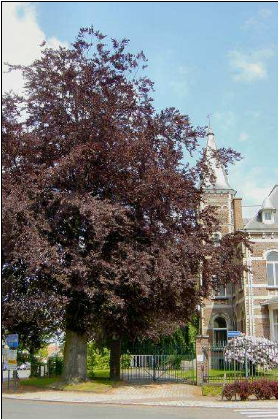
't Kasteeltje –vroegere Villa Wijnants- (ca. 1908), op de hoek van de Marktstraat en de Ringlaan, met daarvoor, op het openbaar domein, de bijna 100 jaar oude rode beuk. Hij staat ongeveer op de plaats waar een grote notelaar stond en daarvoor nog een grote linde ("aen de heerwegh daer eene groote linde staet...", 1619), aan de splitsing van wegen, - heerbaan naar Lebbeke (nu Heirbaan) en baan naar het hof te Neervelde (nu Stationsstraat), aan de ingang van het dorp. (foto 14/05/2004)