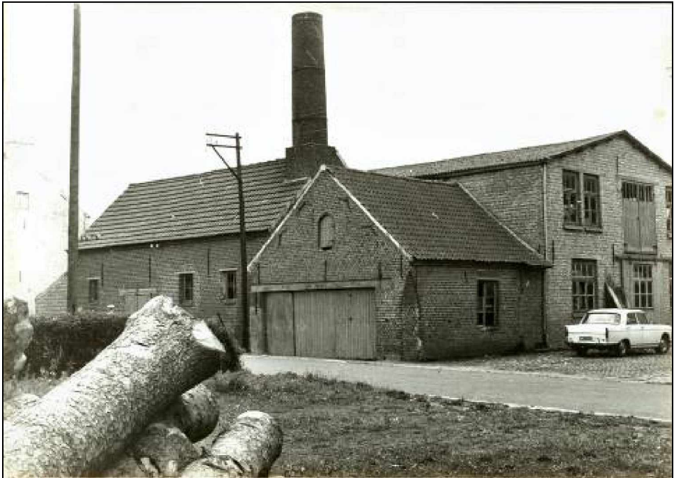
De maalderij-houtzagerij Van den Broeck in de Nanovestraat.

Langs de westzijde van de straat waren de woonhuizen en de maalderij-zagerij (op de plaats van het huidig appartementsgebouw nr. 64) en langs de oostzijde (kant huidig Molenveld) de opslag- en laadplaats van de bomen en het hout. Overlevering leert ons dat op het terrein van de opslag- en laadterrein vroeger putten waren waarin de resten van de afgebroken molen werden gedumpt (metselwerk van de funderingsteerlingen,...).